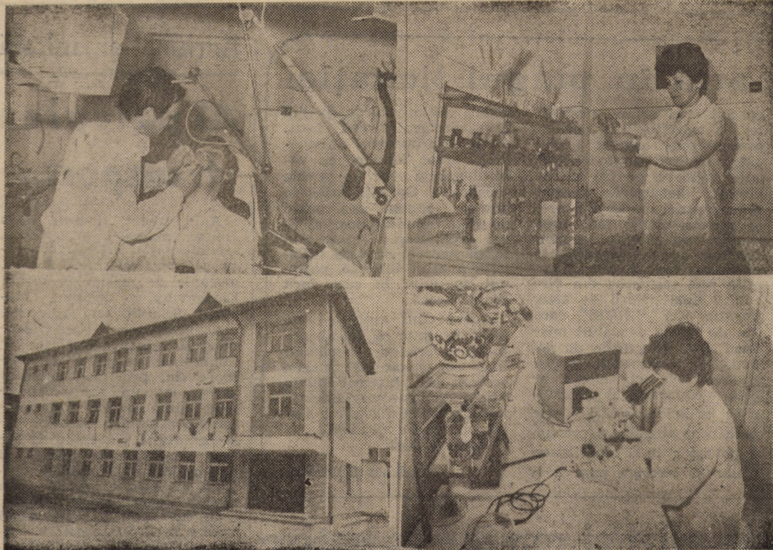
Anul acesta în luna ianuarie s-a deschis în cartierul Ștrand un dispensar, Dispensarul comasat nr. 12. Noua instituție dispune de 8 medici și 16 cadre medii, care deservesc secțiile: pediatrie, medicină generală adulți, stomatologie și un laborator bine dotat.