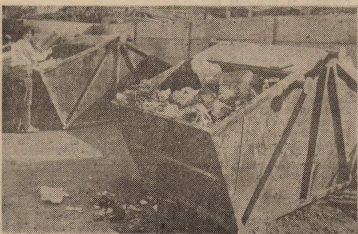
Felul în care este înțelesă prestarea serviciilor legate de curățenia orașului de către o firmă de stat și una particulară credem că este edificatoare și din imaginile alăturate. La dreapta servicii oferite de particulari iar în stînga dezinteresul firmei de stat.

(continuare în pag. a III-a) Nicolae ACHIM