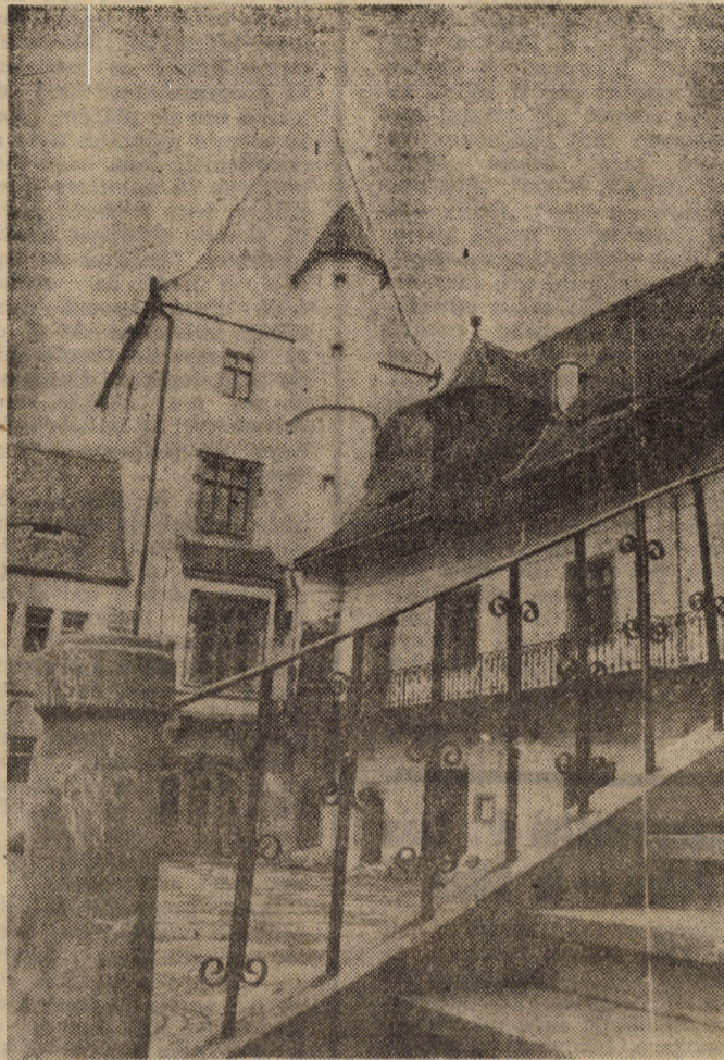
Clădiri vechi încărcate de istorie ce ne aduc în minte farmecul inegalabil al Sibiului

Duminică, 26 mai — Pogorirea Sfințului Duh — Rusaliele (sărbătoare însemnată cu cruce roșie).