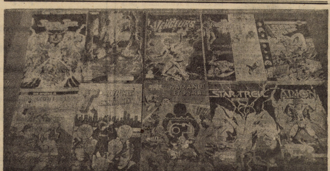
Cărți și reviste cu benzi desenate (Pif, Dr. Justice) se pot cumpăra din librăriile noastre. Copiii ar cumpăra cît mai multe, dar prețul este prea ridicat pentru buzunarul lor...

Și, atenție: așa cum majoritatea nebulilor sînt afară nu în opscii, fiarele sînt printre noi, nu în codru... (n.i.d.).