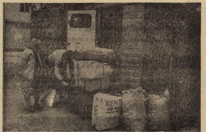
În apartamentul fiecărui cetățean s-au strîns teancuri enorme de maculatură, în timp ce în țară există o criză acută de hîrtie. Cum vom rezolva problema?

Și ar mai fi multe de arătat. Din lipsă de spațiu tipografic ne vom rezuma să le enumerăm doar. Cum se calculează chiriile în noile condiții de creștere a salariilor, cînd plafoanele au rămas tot 1500 lei pe membru de familie? Cît va mai dura repararea caselor distruse în decembrie 1989? Se va stabili cu claritate ordinea în care se vor executa reparațiile clădirilor și respectarea acestor priorități, cu deosebire a lucrărilor de hidroizolare la cele 87 de blocuri în care plouă? Cînd se va clarifica situația spațiilor comerciale licitate dar pentru care nu s-au încheiat contracte și multe altele. Ca și în alte domenii de activitate se... așteaptă. Ce? Fiecare trebuie să-și întreprindă atribuțiile și să rezolve problemele. Prea s-au adunat multe și se stă prea mult în expectativă!