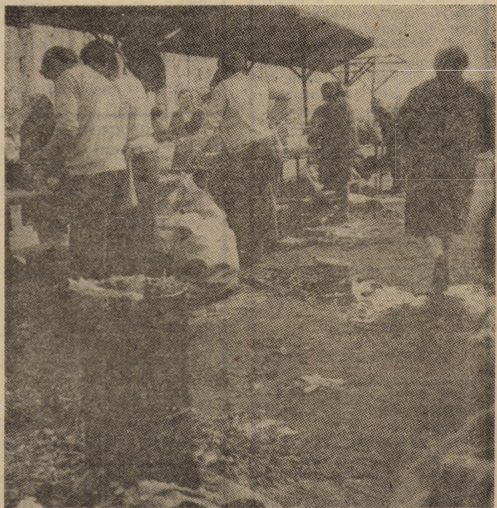
Gunoii, noroi... „piață“ sau „piața“ din cartierul Vasile Aaron. Oare ce părere are municipalitatea, nu se pot aduce cițiva metri cubi de beton sau asfalt?