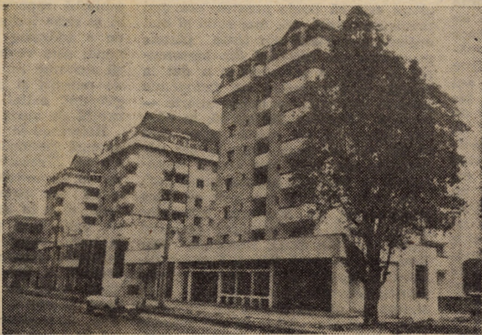
Imaginea alăturată reprezintă noua „poartă” de intrare în Sibiu, dinspre aeroport — Turnișor. Deși au trecut 1—2 ani de când blocurile au fost date în folosință, spațiile comerciale de la parter sînt încă neocupate. Nu are nimeni nevoie de ele?