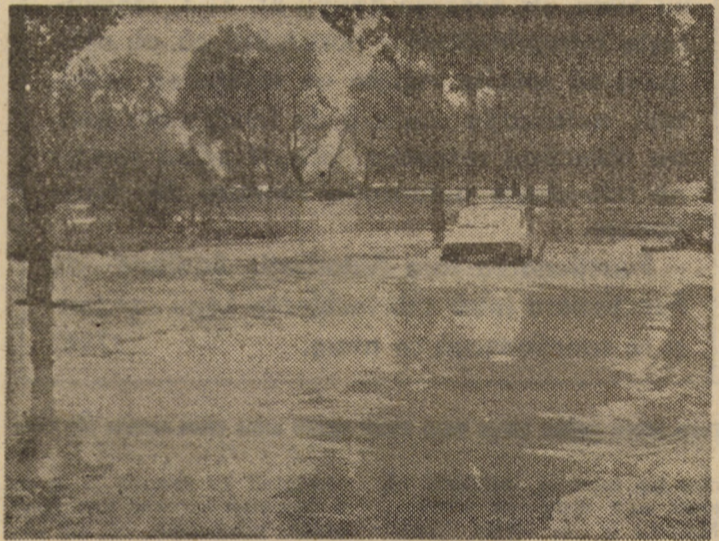
Așa arăta, în urmă cu 2 zile, drumul de la Podu Olt la Turnu Roșu, dar vremea s-a arătat și mai bună astfel încît apele Oltului au început să scadă

Alte personalități au exprimat opinii care se situează în spectrul larg dintre aceste două păreri divergente. Dar, despre aceasta, în numărul nostru de mîine.