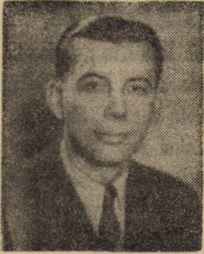
Comandorul av. Conchievici Nicolae

Originar de dincolo de Prut, pe comandorul Conchievici Nicolae l-am cunoscut abia la Oradea Mare, unitatea noastră de Ju-88 a intrat sub ordinele sale, ale unității sale, din cauza pierderilor noastre. Conducea un grup de bombardiere grele de tipul Savoia Marchetti fabricate în licență italiană la Brașov.