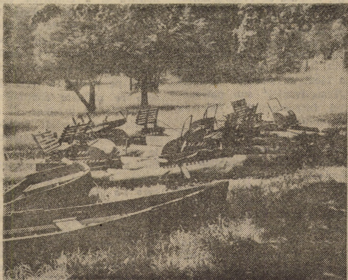
După cum se poate vedea și din cele două fotografii, bărcile și hidrobicicletele care, la această dată trebuiau să alunece pe luciul apei lacului din Dumbrava Sibiului, zac încă pe uscat. Se vorbește de o fisură (mai veche) la baza barajului și că apele, datorită ploilor abundente de acum câteva săptămîni, au pătruns forțat în albia uscată a lacului, inundîndu-l. Să fie oare adevărat? Acesta să fie și motivul pentru care, în zilele caniculare de care avem parte, să nu poți face o plimbare de agrement cu barca?

Relații suplimentare la Camera de Comerț și Industrie Sibiu, pînă la data de 26.06.1991.