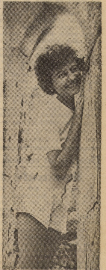
Un zimbet ademenitor adresat evident... fotografului!