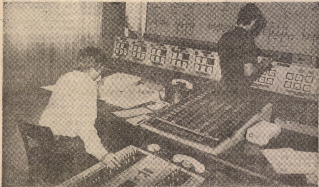
Anul acesta în luna iunie s-au produs 14.243 MWh în centralele din județul nostru, de 3,74 ori mai mult decît în iunie 1990 (3.811 MWh) ceea ce reprezintă 29,8% din energia consumată de județul nostru.