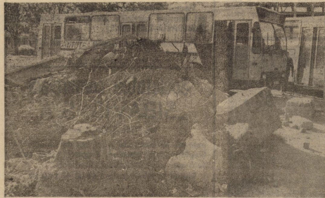
Au plecat constructorii dar și-au lăsat „amprenta” în spatele biseriței de la gară „uitind” un imens morman de fiare și cărămizi după care se joacă de-a ascunsele autobuzele.

— Desigur. Oricât de târziu ar fi, opinia publică sibiană are tot dreptul să cunoască ADEVĂRUL despre tragicele evenimente care au zguduit Sibiu în decembrie 1989.