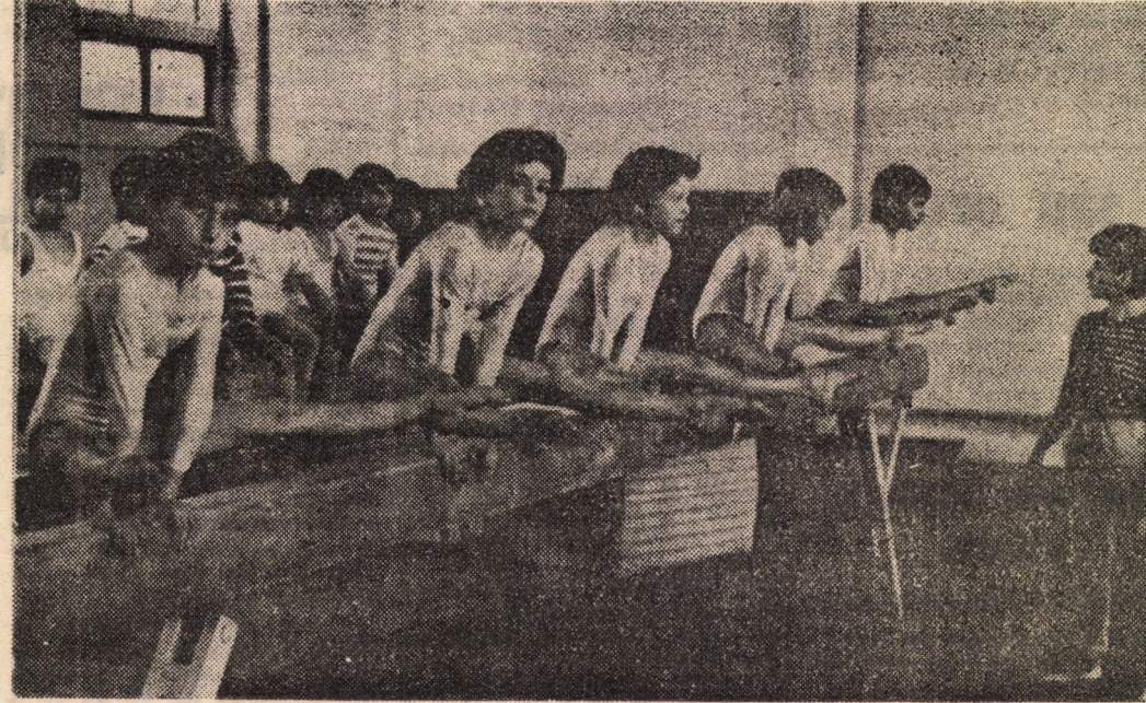
(urmăre din pag. 1)

tățean era securistul Dinulescu sau Dimulescu, nu rețin exact care-i numele corect). După escaladarea gardului, la aproximativ cîteva minute, am văzut vreo 4—5 cetățeni care se îndreptau, cu spatele și cu mâinile ridicate, dinspre punct-control al U.M. 01606 spre grădiniță... La un moment dat, unul dintre ei s-a desprins din grup. Eu n-am auzit comanda „Foc”! Am reținut doar comanda „Culcat”! Asta a și fost practic împușcat mortal, chiar pe trotuarul..., cum ar fi în stînga trotuarului de la locul de staționare al meu, acolo a fost prins de rafală... Instinctul..., cînd am auzit „Culcat”, n-am apucat să iau poziția „Culcat” în față, că era acel grup de oameni, așa că m-am întors „stînga-mprejur” și-am luat poziția „Culcat”. În cădere, m-a atins rafala... Focul mi-a venit din sectorul punctului de control al unității... Menționez că s-a deschis foc și de sus, din clădirea situată unde-i punctul