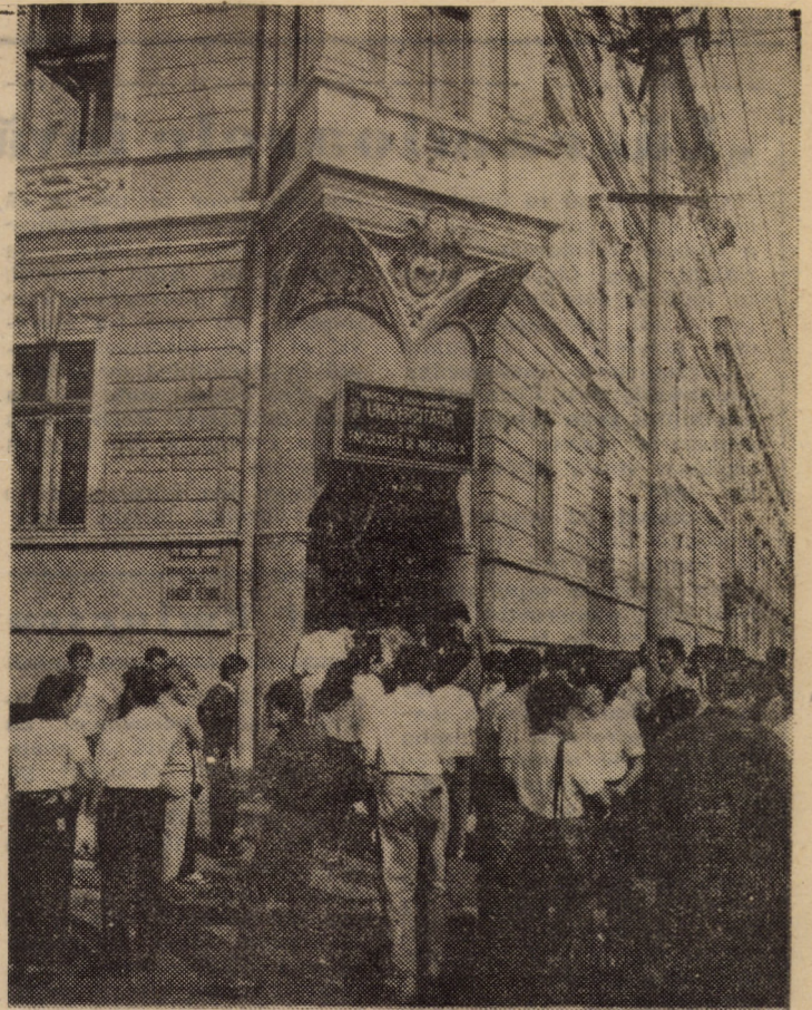
Amfiteatrul emoțiilor, 15 iulie...