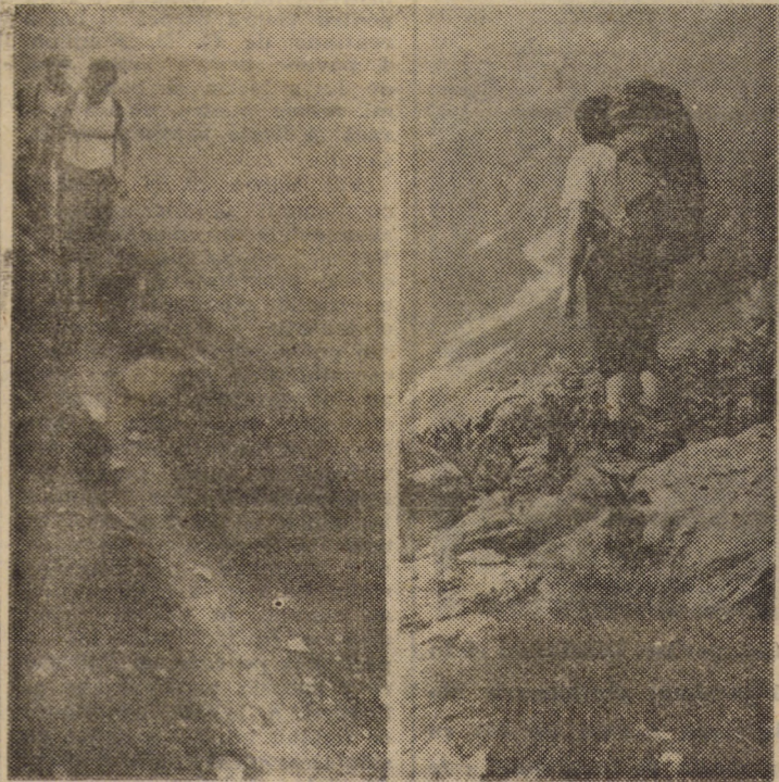
Căutătorii de ozon...