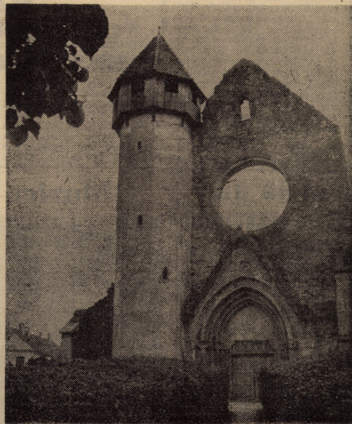
Istorie la porțile Făgărașilor