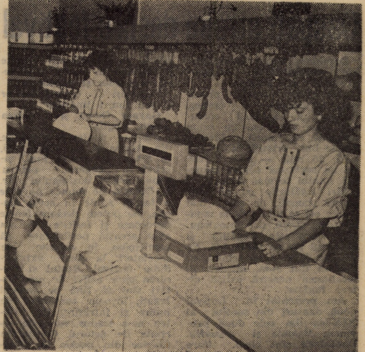
„TAXI-MAZEN”. Programul dreapta surprindea o fațadă laterală a Hanului Dumbrăva.