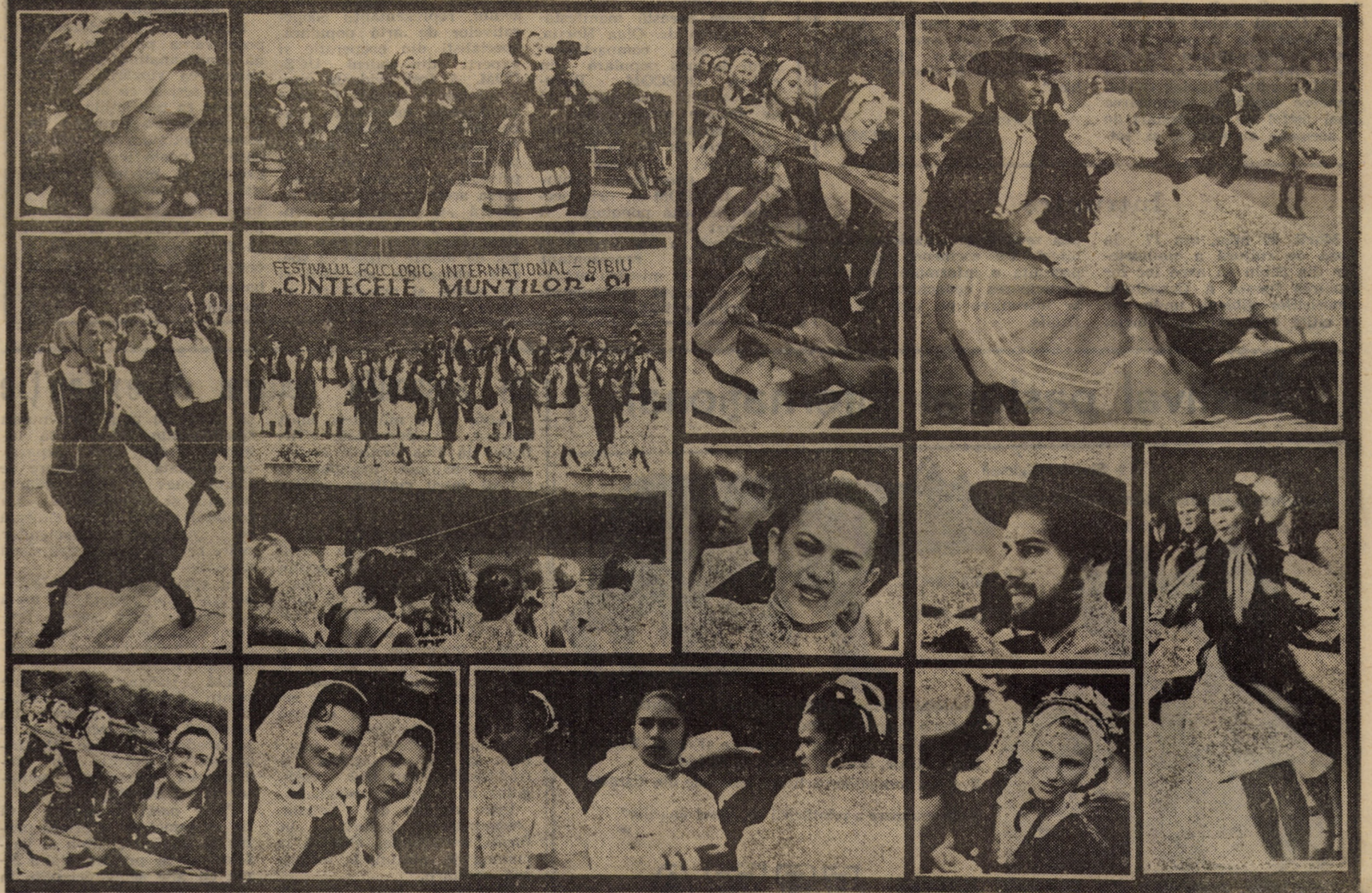
FESTIVALUL FOLCLORIC INTERNAȚIONAL - SIBIU „CINTECELE MUNTILOR” '91