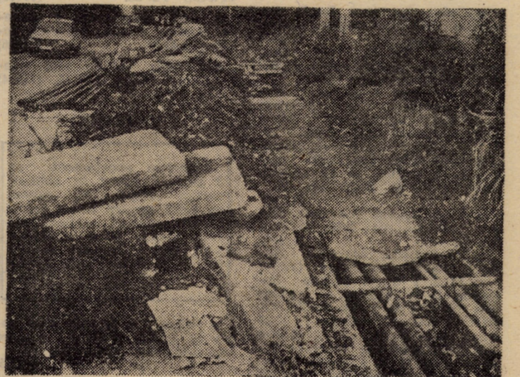
Dupa cum se poate finalitate lucrează la repararea rețelelor termice. Vor fi finalizate la timp lucrările?

Dar mai este un aspect. Noi răspundem de instalații doar pînă la intrarea în bloc. Or, în foarte multe cazuri, canalele menajere deversează în canalele termice, subsolurile blocurilor sînt inundate, așa încît conductele stau în apă. Obligația menținerii lor în stare bună revine locatarilor sau Fondului locativ Oricum.