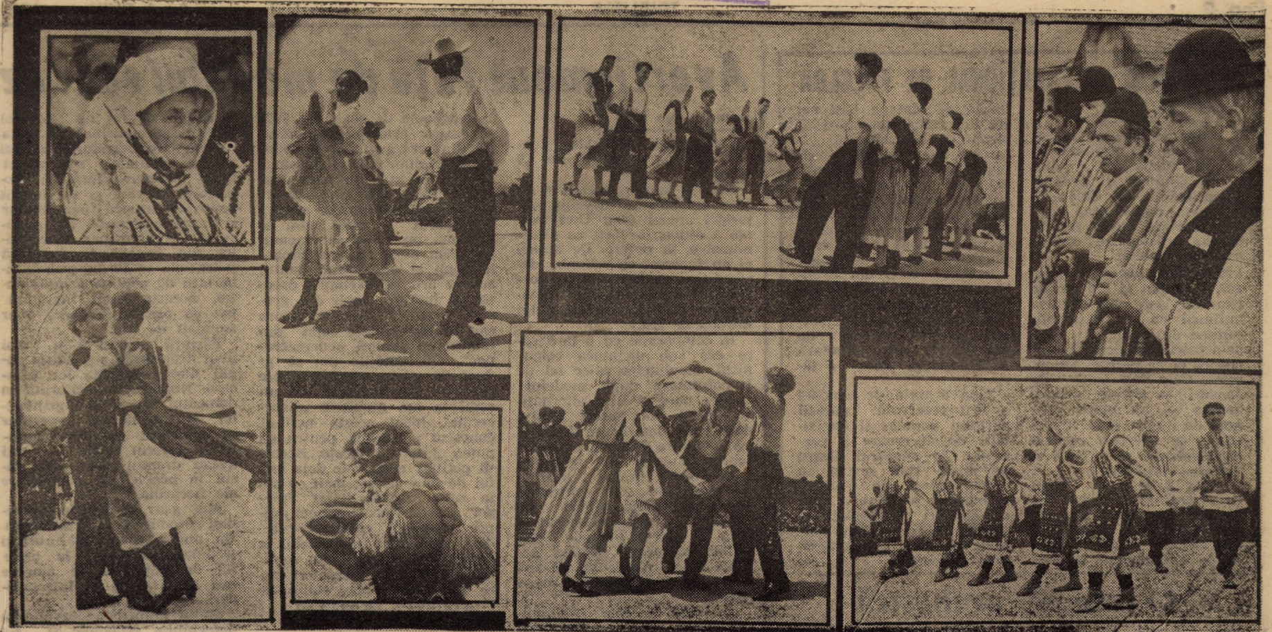
Imagini surprinse la Festivalul internațional de folclor „Sus pe muntele din Jina”