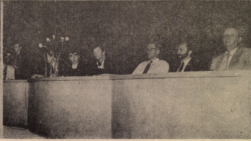
„Educație prin cunoașterea ființei umane” — aceasta este tema Simpozionului internațional de pedagogie Waldorf, care a început marți 6.08 și se va derula pe parcursul a 9 zile la Casa de Cultură a Sindicatelor Sibiu. În foto — două aspecte de la festivitatea de deschidere a simpozionului.