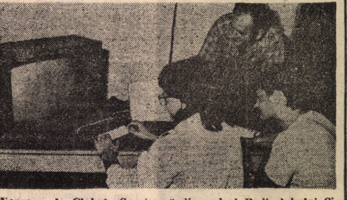
Miercuri la Clubul „Spectrum” din cadrul Radioclubului Sibiu interesul din jurul calculatoarelor parcă este tot mai sporit

Chiar dacă interesul strict particular (uneori meschin) pare a cîștiga teren pe zi ce trece, uite că mai sînt suficienți oameni de inimă, dispuși să-și ajute semenii. Nu-i vorba aici de ajutorarea sinistratilor din Moldova, acțiune de anvergura națională, ci de „Fetița cu chibriturile” a cărei tristă poveste, relatată în paginile ziarului nostru, n-a trecut neobservată (cum trec din păcate atîtea alte semnalări critice). Pe scurt, ea a fost rapid solicitată și angajată de „Record” Sibiu. Începem să respirăm mai ușurați: omenia nu moare!