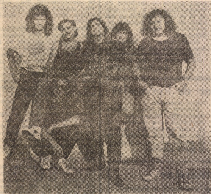
Formația „Compact” și-a lansat marți, la Casa de Cultură a Tineretului, discul „Cine ești tu, oare?”, care se poate procura numai de la magazinul firmei „Panda”, din str. Nicolae Bălcescu nr. 21.

Începînd cu data de 15. 08. 1991 Stația de radio Sibiu transmite și program în limba germană între orele 21—22, program asigurat de studioul de radio Tg. Mureș. Emisiunile pot fi recepționate pe lungimea de undă de 1593 kHz.