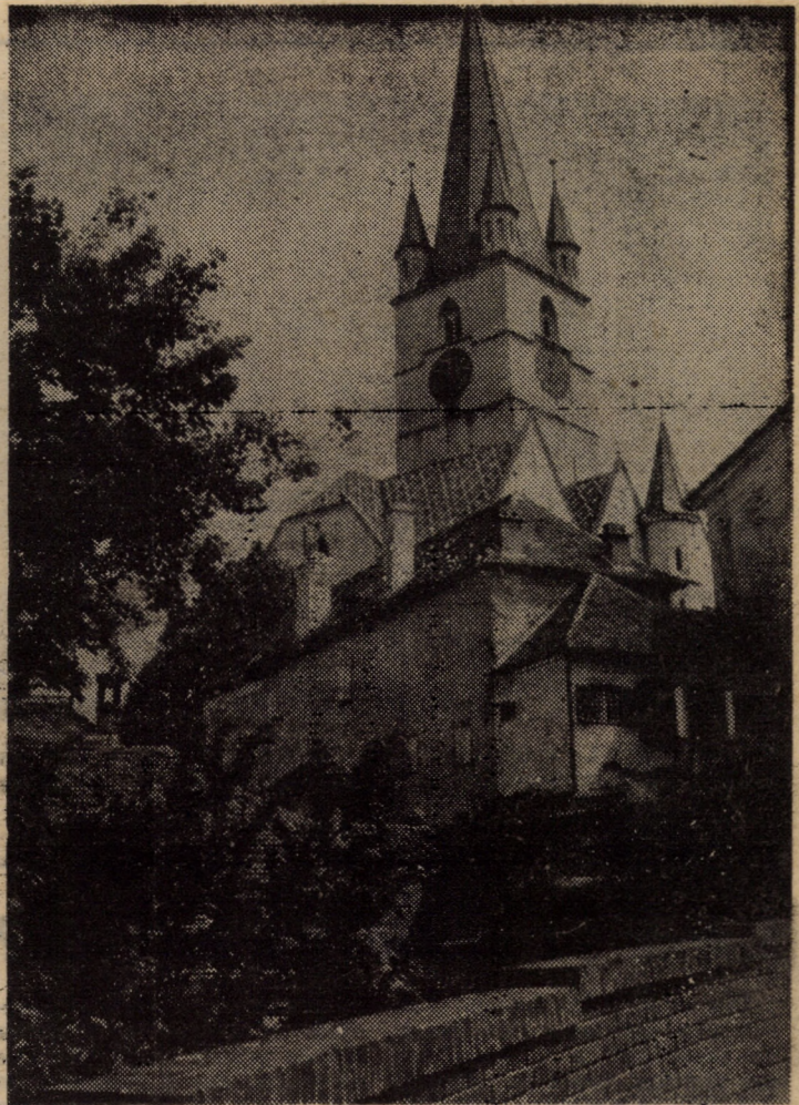
Biserica Evanghelică Sibiu — O rugă se-nalță mereu de aici către cer.