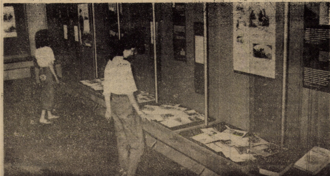
Expoziția „Vestul american — mit și realitate” vizitată de mulți turiști ne atrage prin bogăția documentelor și lucrurilor inedite prezentate.