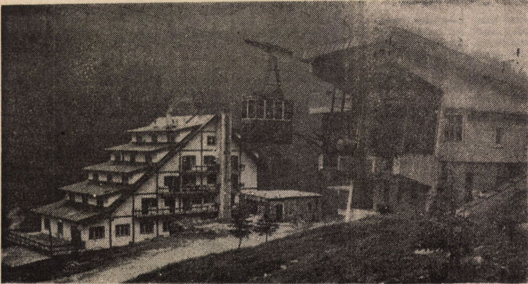
Cabana Bilea-Cascadă, amplasată într-un cadru de un pitoresc aparte, reprezintă totodată unul din punctele intermediare de acces spre frumusețile Munților Făgăraș.