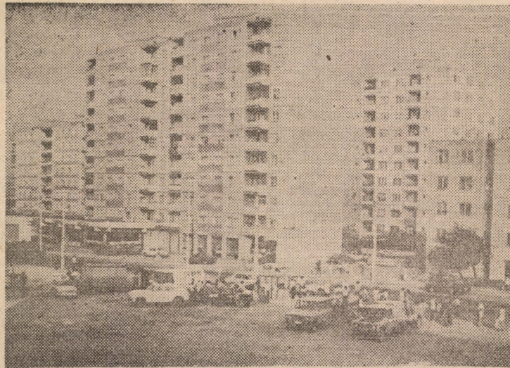
„ECONOMIE”... DE PIATĂ! În cartierul Vasile Aaron a existat odată o piață care de bine de rău ajuta la satisfacerea nevoilor celor aproape 5000 apartamente existente în cartier. A existat pentru că acum nu mai este, deoarece „cineva” binevoitor a dat ordin să se desființeze. Acum pe locul rămas gol, țărani își întind marfa pe jos iar țarabele care existau pe acei spații stau aruncate în Valea Săpunului.