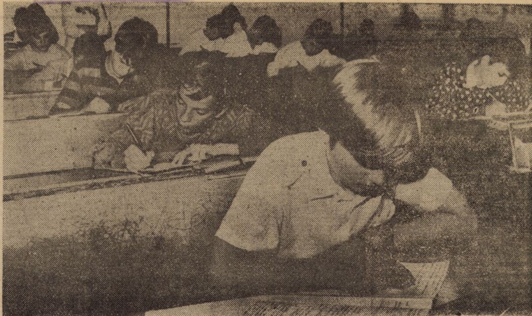
A fi sau a nu fi... admis. Aceasta-i întrebarea, pe care și-o pun cei care acum în sesiunea august-septembrie susțin examenele de admitere în treapta I sau a II-a de liceu