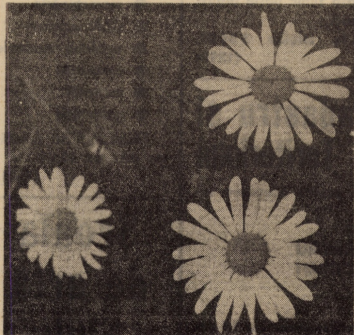
Cu tremur de petale se coace vara în crugul cîmpului aprîns...

Or, din acest punct de vedere a rezultat clar că date fiind stările actuale de lucruri el nu poate fi scăzut cît, dimpotrivă, are tendințe de creștere, ce atît mai mult cu cît societatea a înregistrat pierderi în acest an cifrate la peste 11 milioane lei. Care ar fi soluția? Guvernul să rupă o verigă a acestui lanț și să stopeze creșterile de prețuri, respectiv, prin limitarea prețului la furaje și subvenționarea acestora. Este singura soluție pentru a stopa creșterea în continuare a prețurilor, creștere care ne va aduce, în pragul subnutriției. Măsurile propuse de guvern privind limitarea prețului de vînzare la carnea de categorie a doua și la unele produse sînt doar paleative, care nu rezolvă problema. Este cazul unor măsuri radicale. Cînd vor fi luate?