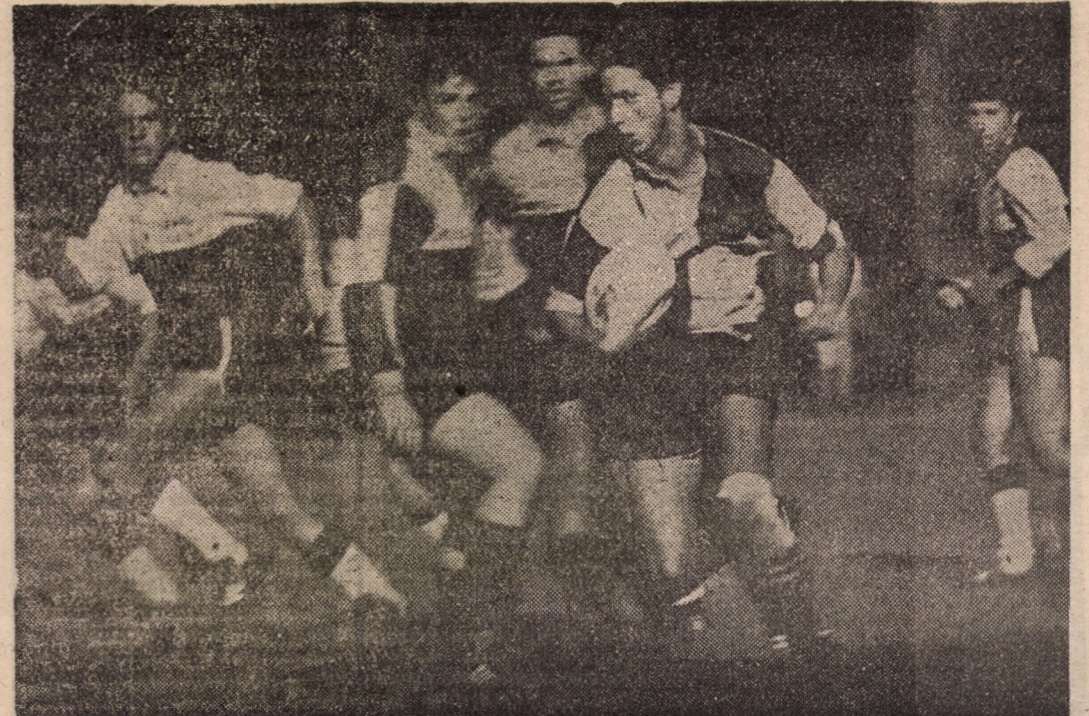
Luptă pentru balenul ca un castravete