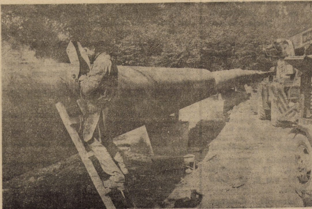
Aducțiunea de apă de la barajul Sadu înaintează spre Sibiu

FACE zilnic înscrieri pentru ajutorul reciproc INVESTIȚIA, între orele 11-17. (1269)