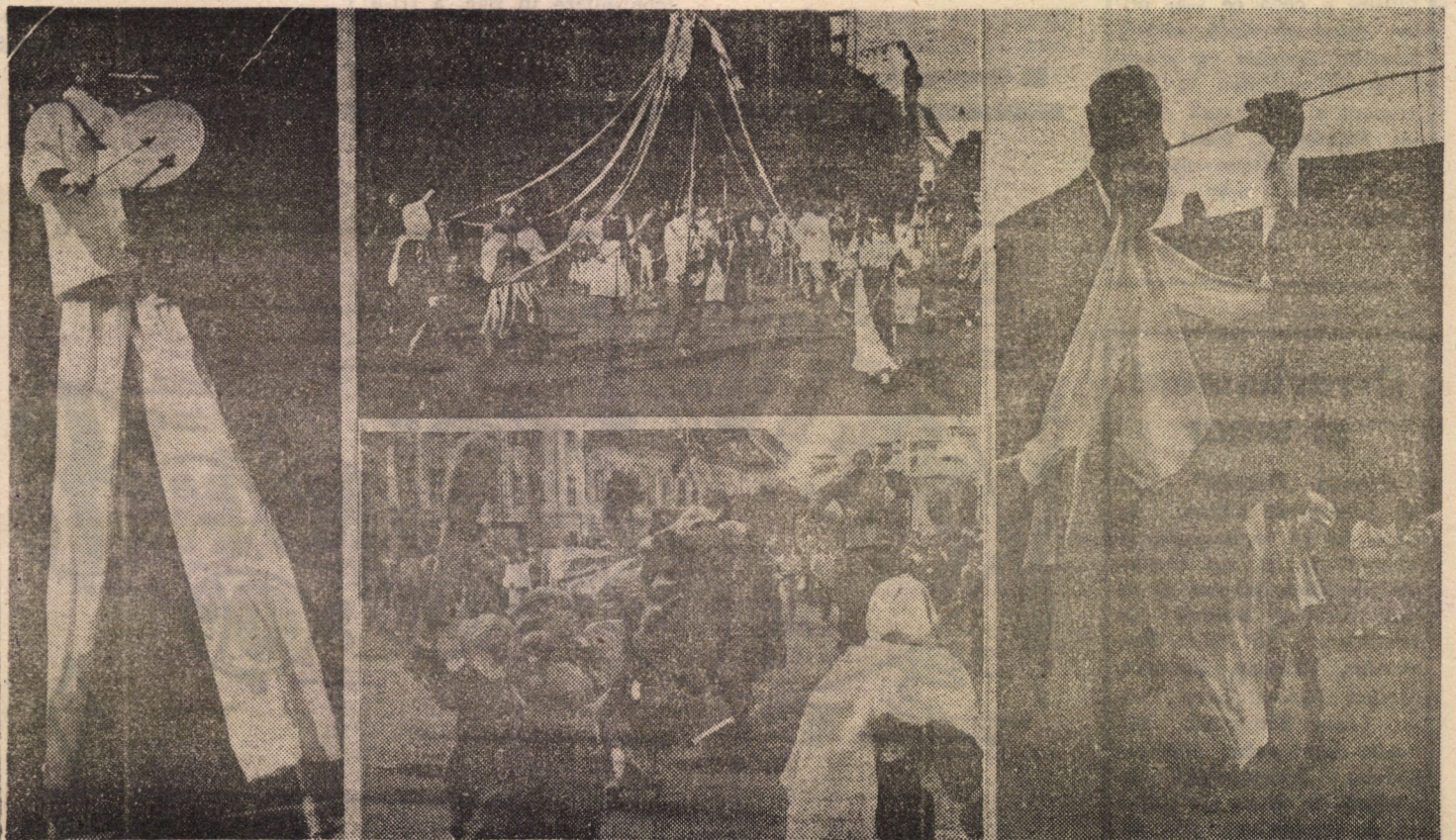
Fascinată și plină de pitorese lumea poveștilor cu balauri, feți-frumoși, zâne bune și spiriduși, o lume fabuloasă scoasă în stradă de actorii Teatrului de păpuși din Sibiu și ai Teatrului maghiar Ciroko din Kecskemet, duminică, 8 septembrie, ca ocazia târgului olarilor

La Centrul de primirea sticlelor și borcanelor din localitate se regăsesc cam aceleași probleme ca peste tot: oamenii sînt refuzați pe motiv că nu există ambalaje, nu se respectă programul de lucru, nu sînt afișate prețurile pe fiecare sortiment în parte (există o listă, dar nu oricine știe să o citească) etc. I.C.R.A. Mediaș trebuie să ia măsuri. (I.S.).