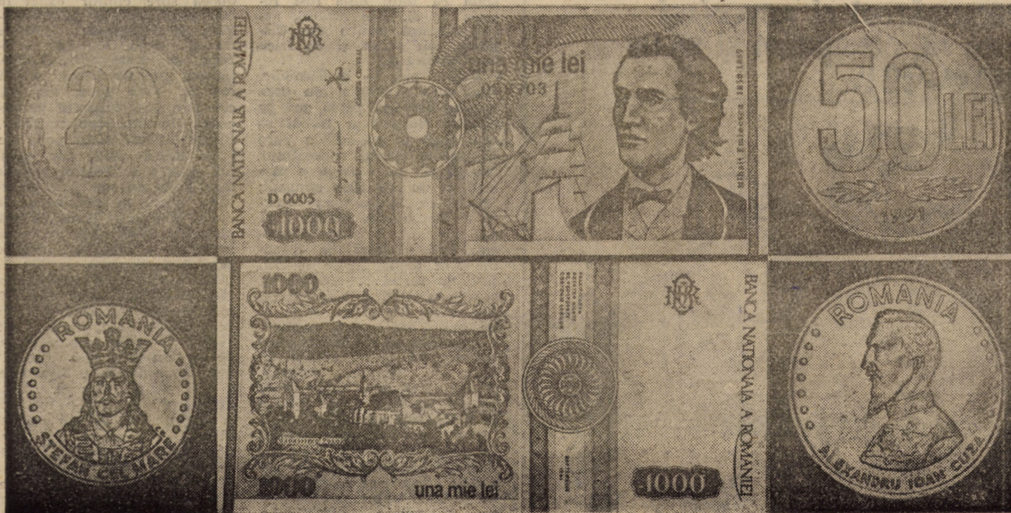
Bani noi în circulație. Dar, nu uitați! Nu ci aduc... forciroa