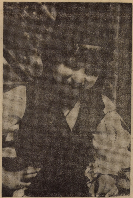
Vremea trece, vrînd-nevrînd, Cum sînt trasă prin inel, Ia ghiciți, ce am de gînd? Să-mi găsească un... ciobănel! Text și foto: Fred NUSS