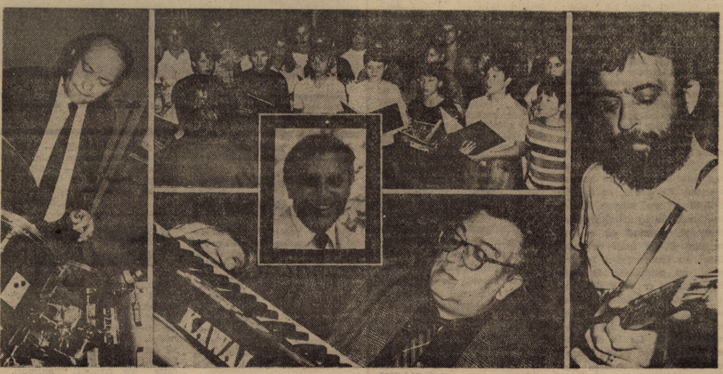
Imagini de la concertul omagial dat în memoria profesorului Nae Ionescu — inimă ce a vibrat în consonanță cu sunetele muzicii ca să ridice Sibiu la rangul de capitală a jazzului din România