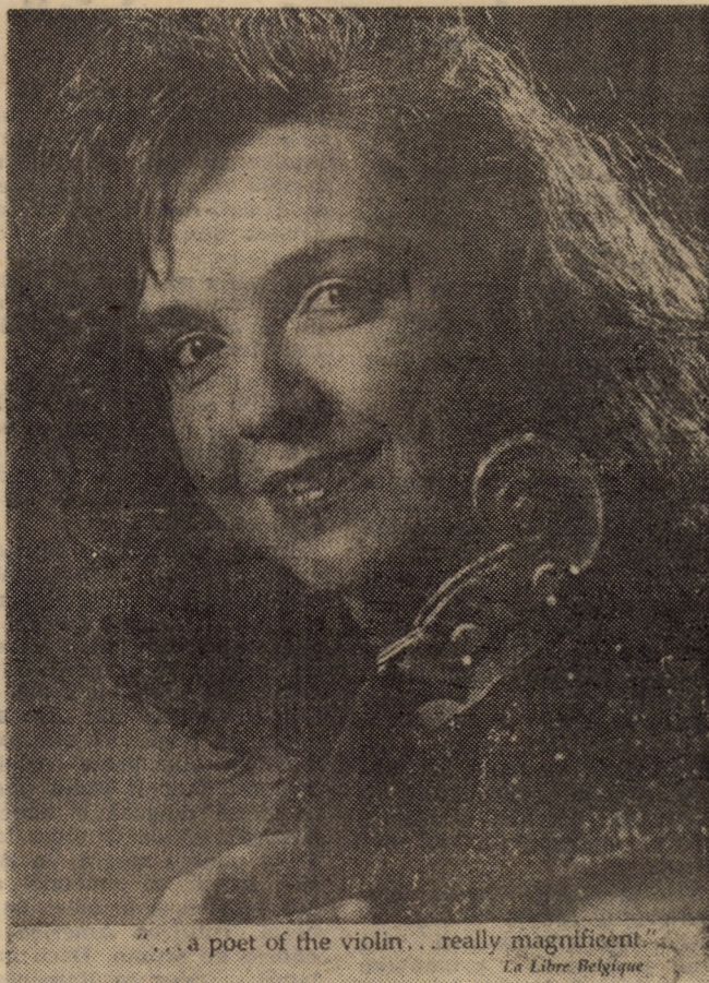
... a poet of the violin... really magnificent La Libre Belgique

„E bogat cu adevărat cel ce e bogat în spirit”