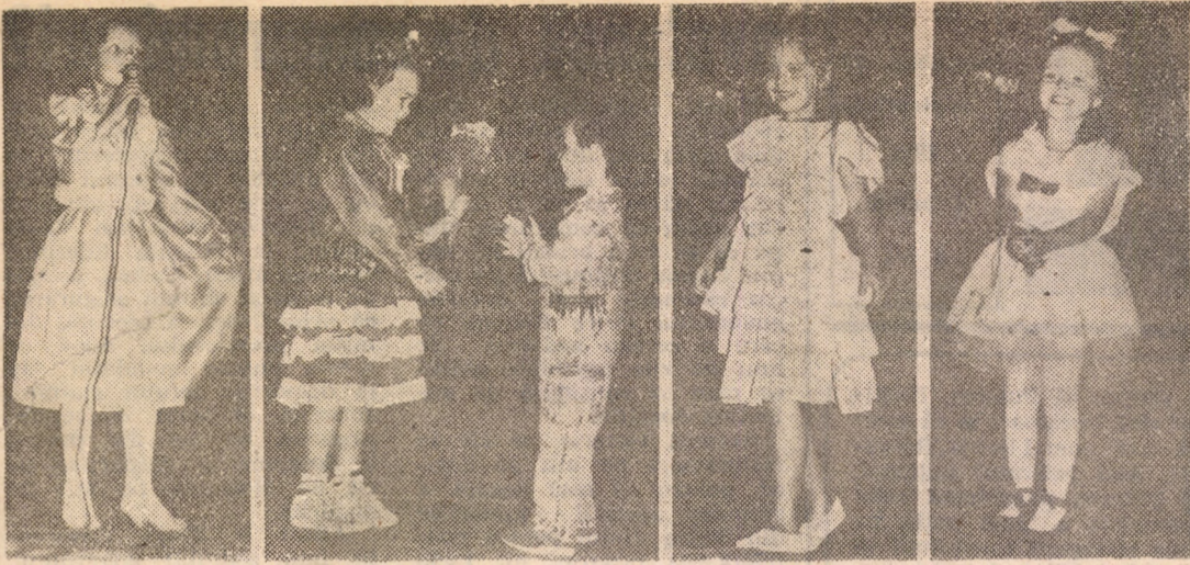
Joi, 26 septembrie la Casa de Cultură a Sindicatelor s-a desfășurat concursul Tip-Top-Minitop. Nu vă vom spune care sînt finaliștii acestui concurs, căci fiecare copil în felul lui este un câștigător. Beneficiul a fost oricum al spectatorului pentru că întreaga sală timp de câteva ore a uitat brutalitatea evenimentelor, regăsindu-și optimismul și zîmbetul pierdute.