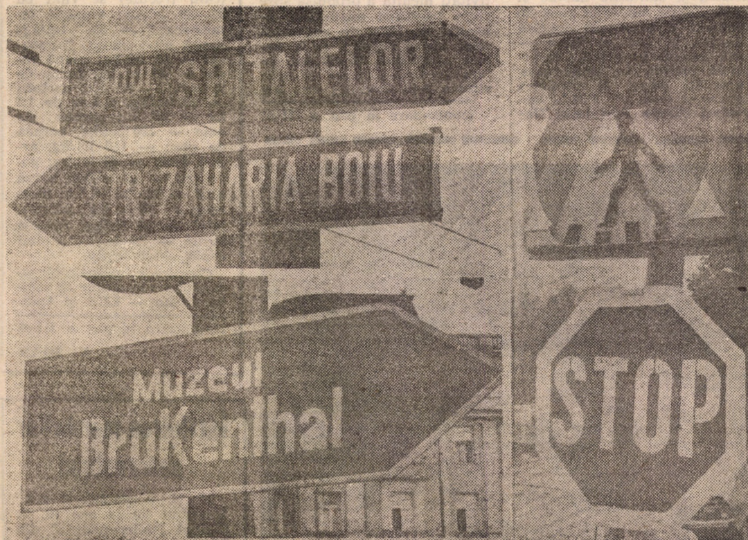
Cei răspunzători cu panourile și indicatoarele rutiere s-au străduit să instaleze indicatoare noi. Dar oameni iresponsabili, certați cu buna civilitate, reușesc să distrugă o parte din indicatoare și panouri