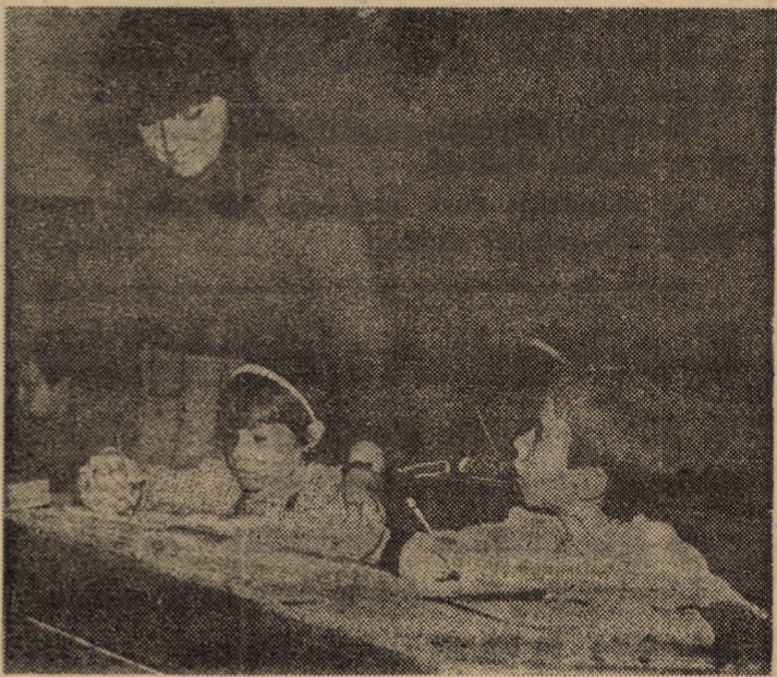
Incet, incet să învățăm alfabetul. Să seriem a mic de mină, A mare de mină...