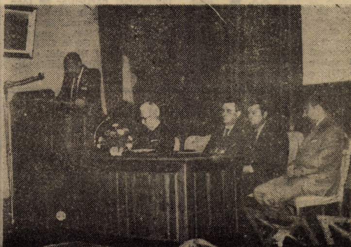
Aspectq de la lucrările Conferinței naționale de Ortopedie Traumatologie care se desfășoară în aceste zile la Sibiu.