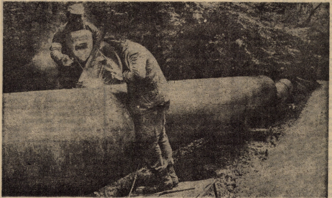
Vom avea mai multă apă în Sibiu? Constructorii conductei de la barajul Gura Rîului spre Sibiu spun: Da!

Întilnirea va avea loc la Sibiu — în sala Studio a Casei de cultură a sindicatelor, iar la Mediaș — la Casa de cultură a sindicatelor.