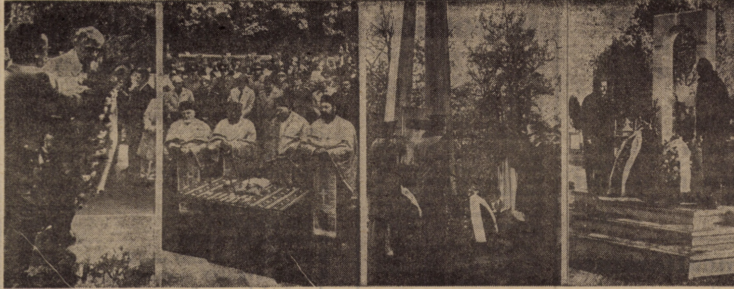
Ziua Armatei Române — 25 octombrie — a fost marcată în Sibiu și în alte localități ale județului nostru prin depuneri de coroane de flori la cimitirele și monumentele eroilor, care au dat jertfa supremă în luptele purtate de poporul român pentru păstrarea ființei naționale și apărarea fruntelor țării.

La ceremonialele desfășurate ieri, la Cimitirul Eroilor Români din pădurea Dumbrava și la Mormintele Eroilor Revoluției din Decembrie, din Cimitirul central — surprinse în imaginile alăturate — au participat reprezentanți ai prefecturii și primăriei municipiului Sibiu, ofițeri și subofițeri din cadrul M. Ap. N., de Poliție și S.R.I. veterani din cel de al doilea război, precum și membri ai familiilor celor dispăruți.