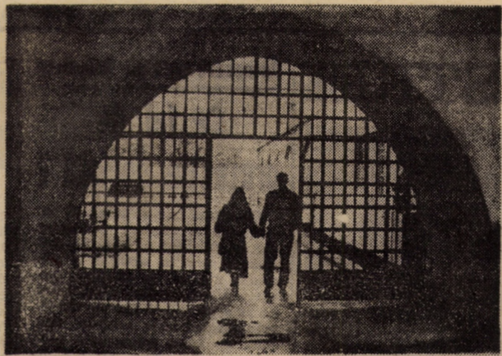
Mină în mină vom pași amîndoi prin poartă...