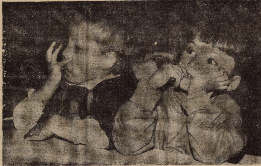
Acum că am terminat şi cu Constituţia...