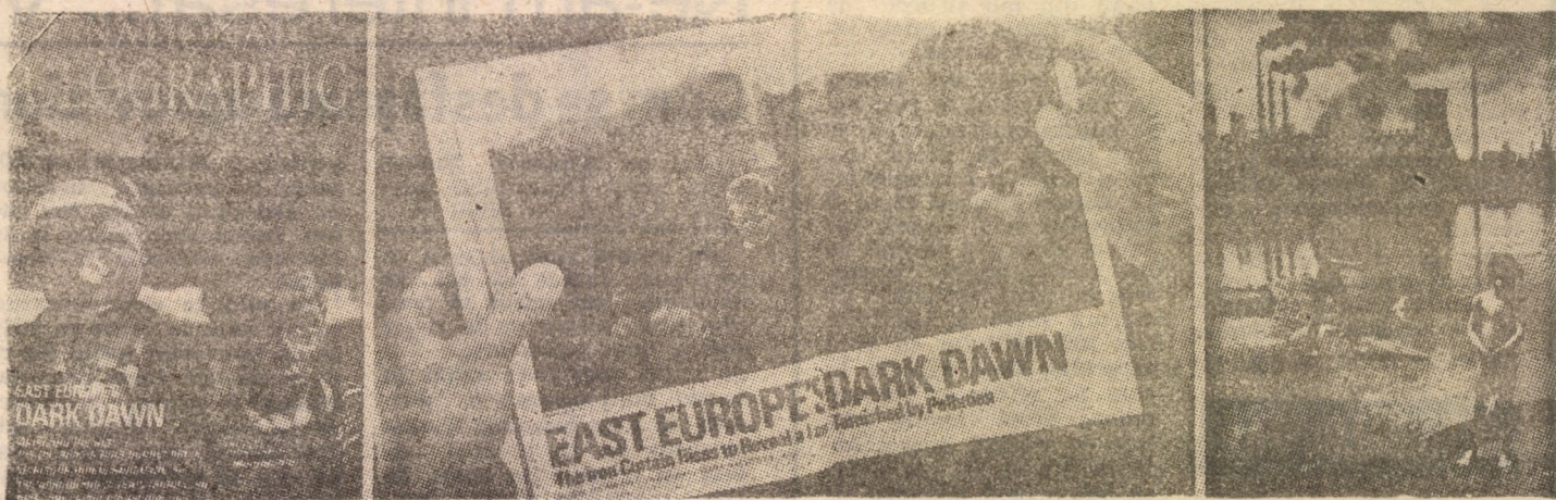
Sub genericul — „RĂSĂRITUL ÎNTUNECAT AL EUROPEI DE EST” celebra revistă americană „National Geographic” publică articolul „Cortina de fier se ridică ca să releve un pămînt întunecat de poluare”. Se ivește totuși, spun autorii, o rază de soare și pentru Coșea Mică