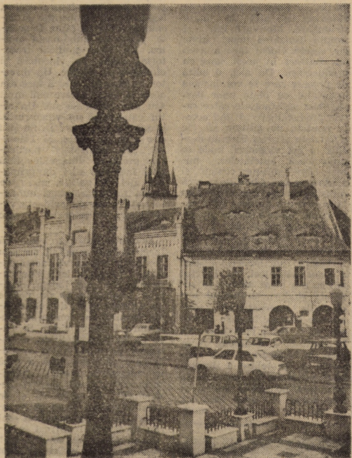
Sibiul — la una din orele sale de liniște...

Duminică, 1 decembrie, ora 19: secția germană: „Meister Pathelin”, regia Karl Heinz Maurer.