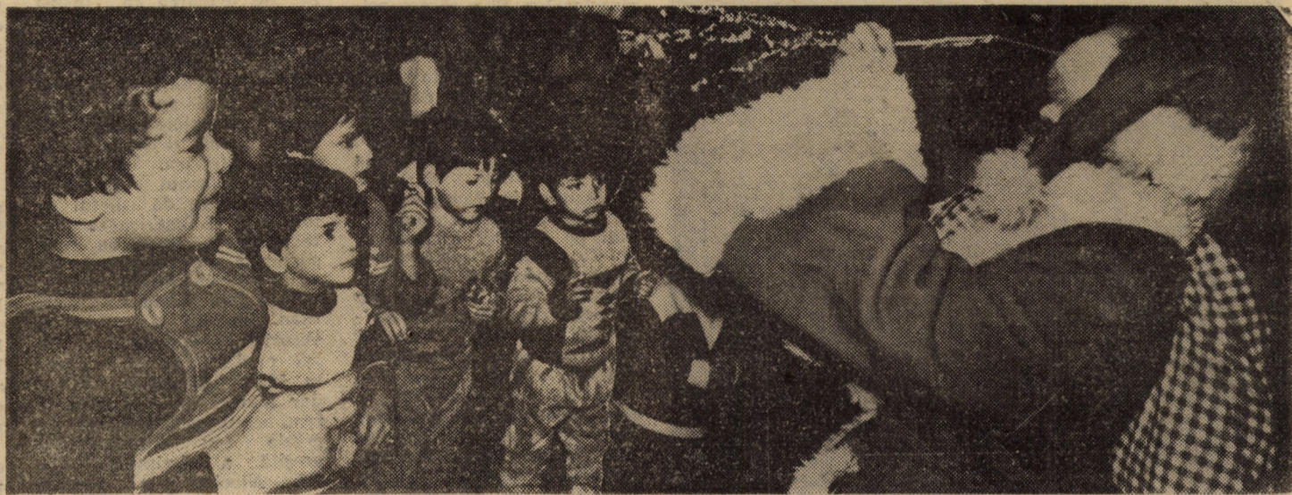
Cam scumpe bucuriile noastre. Nu-i așa, Moș-Nicolae?