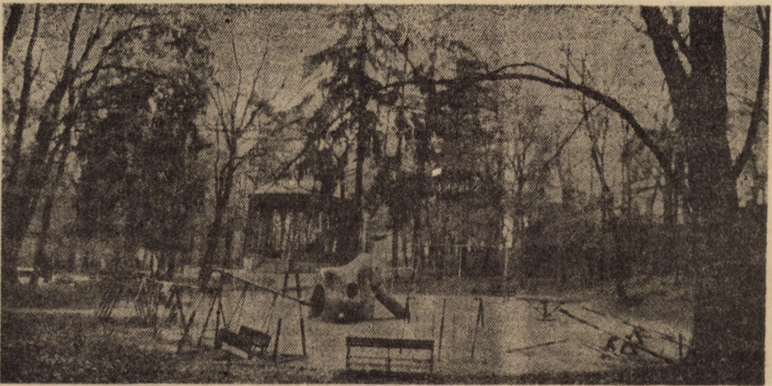
Sibiul nostalgic... Parcul Sub arini și anume anotimpuri