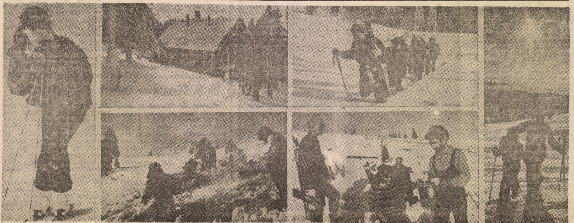
Album de vacanță montană

Societatea Comercială PECO S.A. Sibiu informează posesorii de autoturisme, motocicletă și motoare (proprietate personală) că începînd cu 7 ianuarie 1992, eliberarea tichetelor pentru carburanți se va face la sediul unității din str. Oțelariilor nr. 67 pentru zona Sibiu (inclusiv Cisnădie și Agnita) și Depozitul PECO Mediaș, str. Nisipului nr. 1 pentru zona Mediaș (inclusiv Copșa Mică și Dumbrăveni). Se precizează că eliberarea tichetelor se face numai în zilele de marți, miercuri și vineri, între orele 8-12.