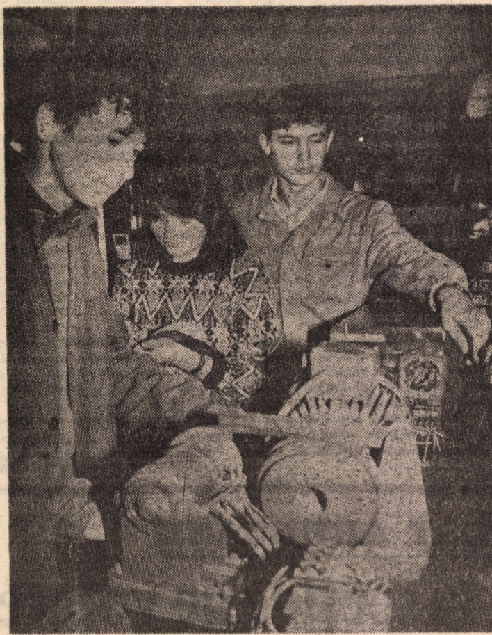
La liceul Independența baza materială îi ajută pe elevi să învețe a, b, c-ul meseriei încă de pe băncile școlii