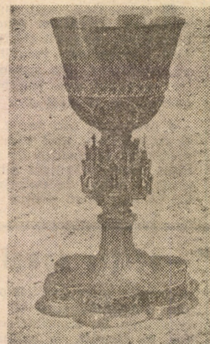
Potir din perioada goticului târziu, din Slimnic, începutul secolului XVI.