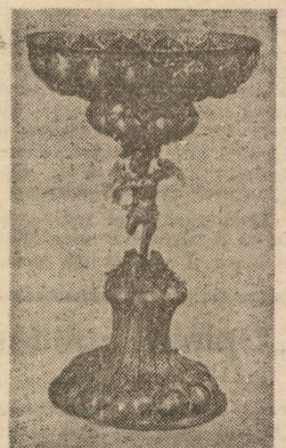
Potir din anul 1690 realizat la Sibiu de Sebastian Hann