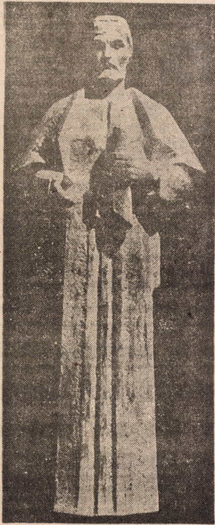
Imre Gyenge Nicolai Olahus

Fusesem obișnuiți cu bilanțuri literare la fiecare sfârșit de an; de astădată, nimic și mai rău ca oricând: producția de carte originală de anul trecut a fost, la nivel național, săracă și irrelevantă, iar revistele de profil (patronate de subredacția Uniunii Scriitorilor) și-au suspendat apariția, încât a fost cu neputință să se mai facă vreo privire retrospectivă. Despre ce a însemnat actualitatea literară românească în 1991, rămâne ca fiecare cititor — dacă este interesat — să se descurce pe cont propriu, ceea ce nu-i va fi deloc ușor cît timp circulația cărții a fost și continuă să fie defectuoasă.