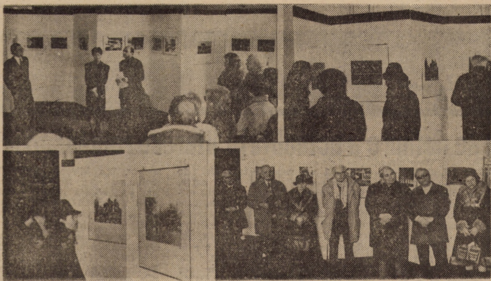
Aspect de la vernisajul expoziției de fotografii „Germania și Europa de Est”: Amănunte în pagina a 2-a: TRIBUNA CULTURALA