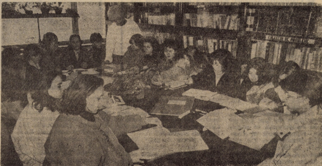
Biblioteca Lic. O Goga — oră de engleză

nînd aceeași: filozofie, psihologie sau biologie (cl. a XII-a) sau algebră (cl. a IX-a și a X-a). Numai la Facultatea de filozofie din București proba a doua se înlocuiește cu o limbă străină: traducere, retroversiune, compunere. ■ La Facultatea de psihologie se cer numai anumite capitole din biologia de cl. a IX-a și a XII-a. ■ La Facultatea de istorie (profilul Istorie — o limbă străină), candidații pot opta numai pentru acele limbi străine care se studiază ca a doua specializare la instituția de învățământ superior unde concurează. ■ La Facultatea de educație fizică și sport în etapa a doua este obligatorie proba scrisă la Limba română.