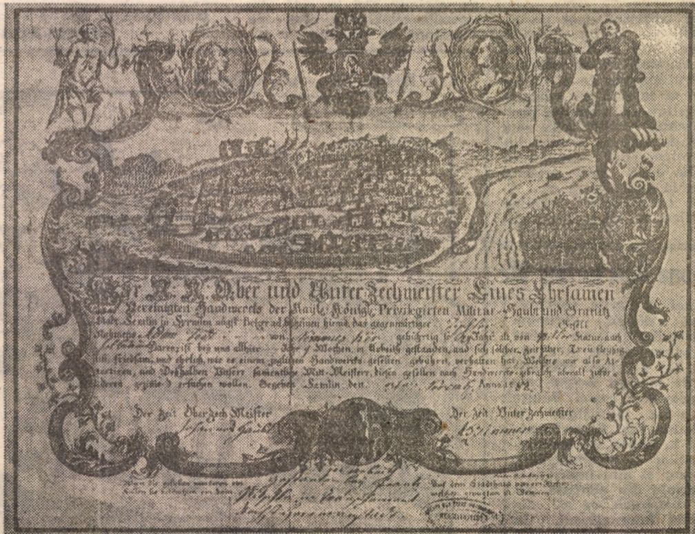
1782, nov. 3. Certificat de învătătură eliberat unei calfe de timplă din orașul Semlin, venit în peregrinaj la Sibiu