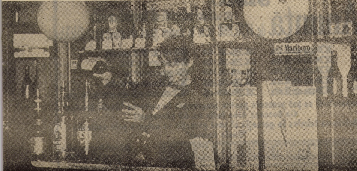
Reportaj publicitar realizat de Victor DOMȘA