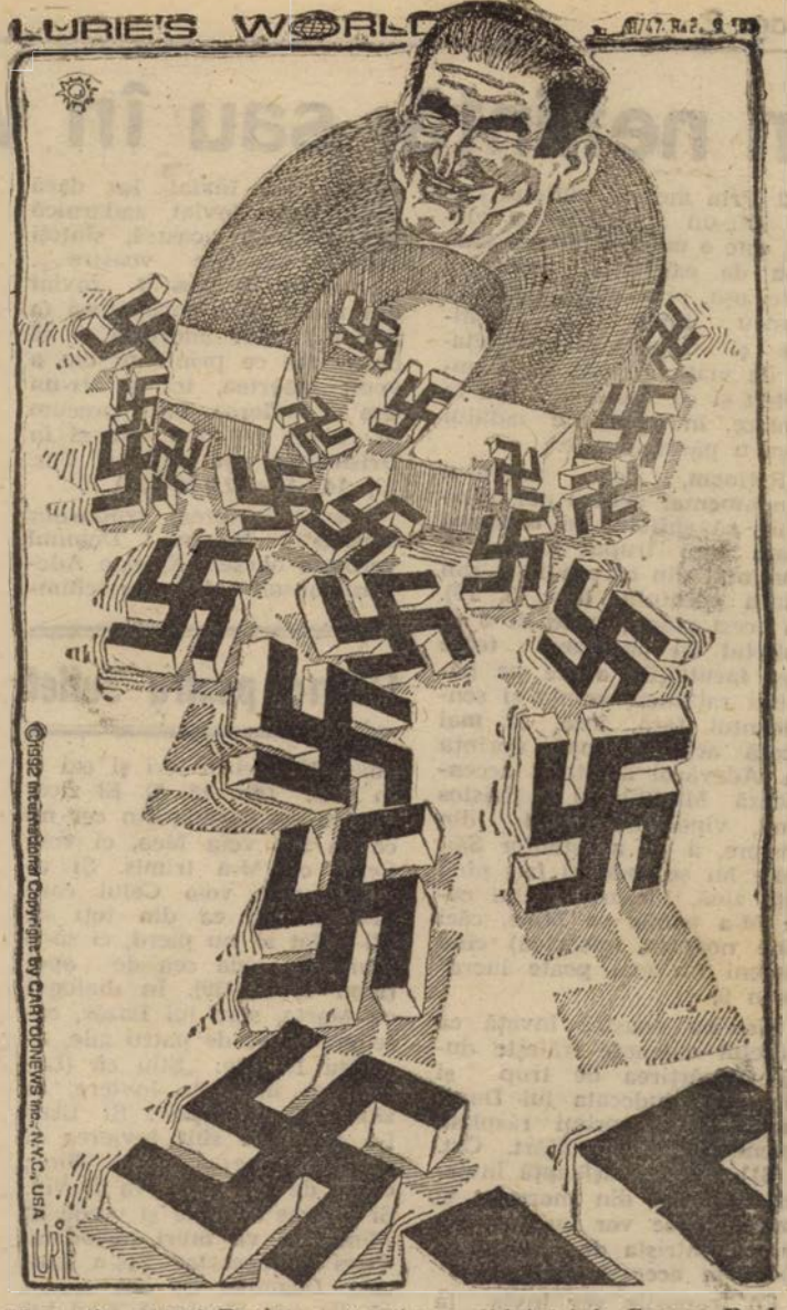
Magnetismul lui Buchanan (contracandidatul lui George Bush la investitură din partea republicanilor — n.n.)

Anul CVIII, nr. 591 Simbătă, 21 martie 1992 8 pagini, 10 lei