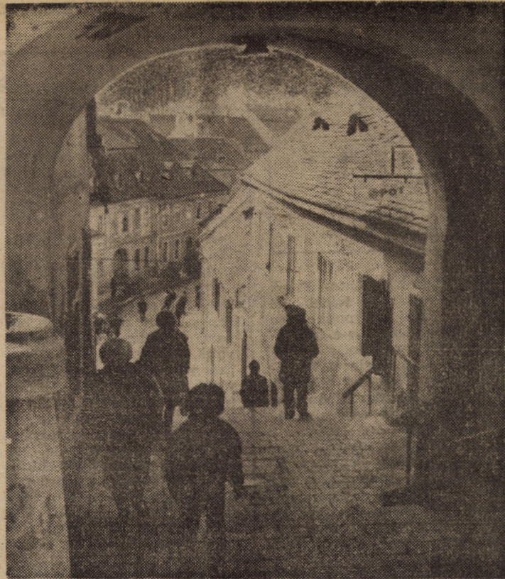
Poartă de intrare în cetate