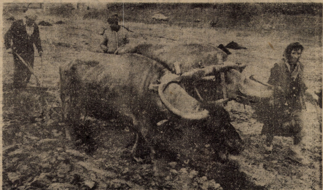
Primăvara și-a intrat în drepturi, nu și țărani, mulți dintre ei nefiind puși nici la această dată în posesia pămîntului ce li se cuvine.

Cei care au avut, totuși, această fericire, nu pregetă acum să și-l lucreze cum pot — ca în imaginea surprinsă lingă satul Săcel, comuna Săliște — ca să aibă ce culege la toamnă. Privind această fotografie, sîntem convingși că vă „încearcă” o întrebare: Cînd va ajunge și țărănul român să facă agricultura ca la sfîrșit de secol XX și nu ca la începutul său?