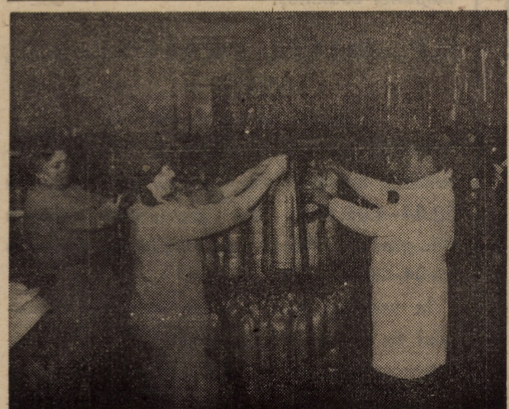
Pregătiri de Paști la SALCONSERV MEDIAȘ

ram V. Actualități. 10,20 Cămilei. 10,30 „Sarah”. de muzi- Interferen- luzica pen- ti. 14,00 Me- Tradiții. npremiera 5 Preuni- Actua- lară. 15,30 16,00 A- muzicală. onviețuri. Actualități. re tran- 7,35 Oa- ri, obicei- 0 Salut, 9,00 Stu- economic. ne anima- 20,00 20,35 5 Telecti- „Cu ochii 22,40 n lume. ca Parla- Actua- Meridia- lui. 0,10 progra- ma - Pacea: orele 9; 17 și 19. anaticul”, : 11,30; 17,30 și i: „Joni”, 3; 15; 17 — Pro- margi- i”, orele 15; 17 și „Un negru”, 4; 16 și „O gră- pani”, o- și 19,30. „Lovitu- un”, ore- 19. VENI: „, orele SIBIU 14: Știri, e, Sport, Muzică; le serii, e, Ma- re), Mu- ă popu- i joc ar- brele se- a. eo MITEA) a fi ră- erul va- alocuri verse de a mun- iile vor mă de ntul va înă la intensi- are din empera- e se vor 1 și 3 e maxi- și 11