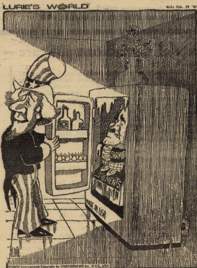
Înghețându-i, răcorim puțin Orientul Mijlociu