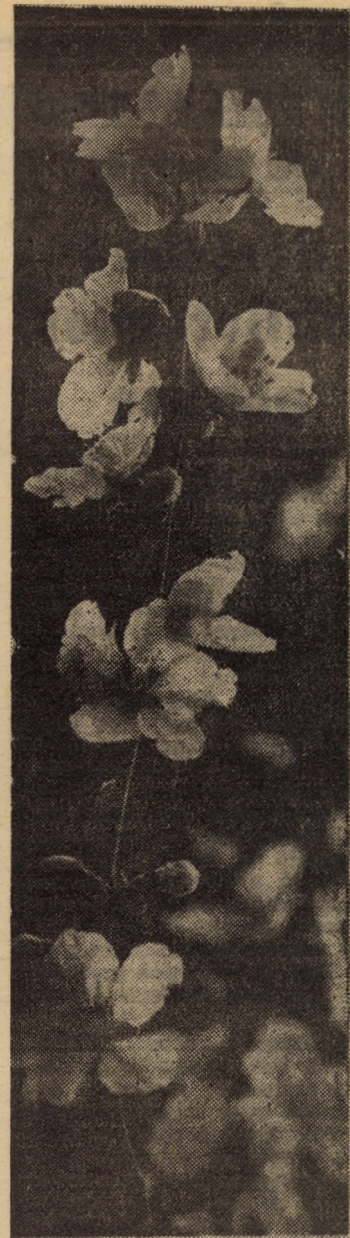
Mirifica purificare

Orele 13—14 — Știri, Știri sportive, Magazin, Muzică; 22—24 — Știrile serii, Știri sportive, Magazin (reluare), Muzică, Muzică populară: „Cînt și joc ardelenesc”, Orele serii, Muzică.