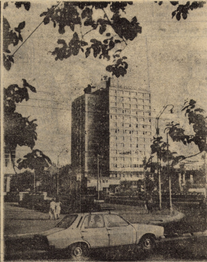
Propunere pentru o vedere

Asociația Generală a Economisților din România — Filiala Sibiu invită pe toți economiștii — în ziua de 15 mai a.c., ora 11, în aula „Avram Iancu” a Universității sibiene — la o dezbateri pe teme: ■ Tranziția la economia de piață — între realizări și erori ■ Aspecte de tranziție la economia de piață din țările, est-europene ■ Alte teme, la propunerea participanților; ■ Probleme de organizare.